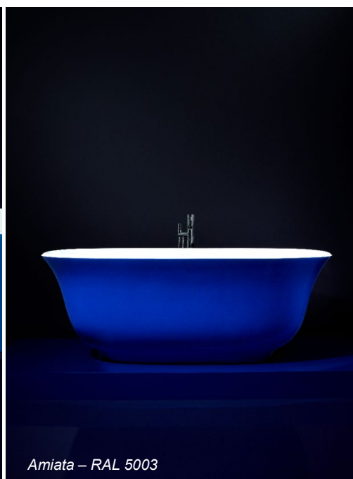
Amiata – RAL 5003