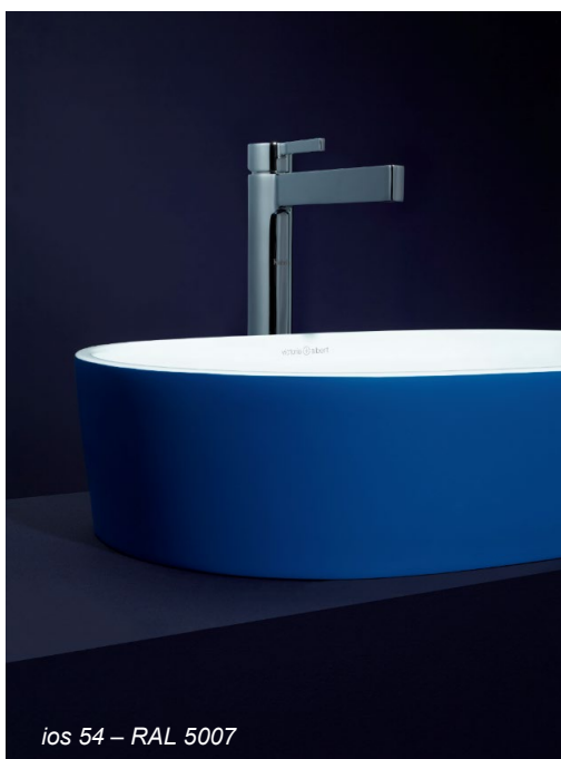
ios 54 – RAL 5007

Le dynamisme et la fluidité de l'eau ont depuis toujours influencé l'architecture et la décoration intérieure, à l'instar de Fallingwater, iconique maison de Frank Lloyd Wright ou du Vessel de Thomas Heatherwick. Rappelant des sentiments de calme et de bien-être tout en créant un dialogue entre les formes solides et liquides, la palette Wavelengths s'inspire des océans profonds, offrant ainsi un spectre de couleurs apaisantes qui navigue à travers les eaux sombres de l'Atlantique, la Méditerranée ensoleillée et le bleu-vert de la mer Égée.