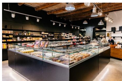
Boutique La Maison Française à Aix-en-Provence

Des coffrets uniques qui mêlent le meilleur de l'épicerie fine et de l'art de la table français.