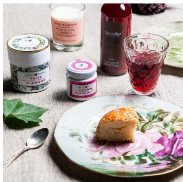
Nectar Framboise Alain Millat Bougie Cirerie de Gascogne Confitures Confiture Parisienne

La Maison Française regorge de belles pépites made in France qui surprendront les mamans comme les papas. Chocolats fins, thés,